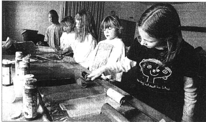
Kinder beim Bücher-Machen